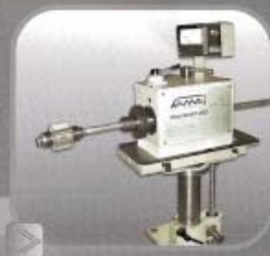
RUGO 200 Bruñidora horizontal de Bancadas, sistem a autocentrante de avance micrométrico con tope final de carrera. Rango Ø 54 a 104mm. y rango extra hasta Ø 125mm.

TODOS NUESTROS ELEMENTOS ESTÁN MONTADOS CON HERRAMENTAL DIAMANTADO; ESTUDIADO Y DISEÑADO BAJO ESTRUCTAS NORMAS QUE GARANTIZAN PRECISIÓN Y CALIDAD.