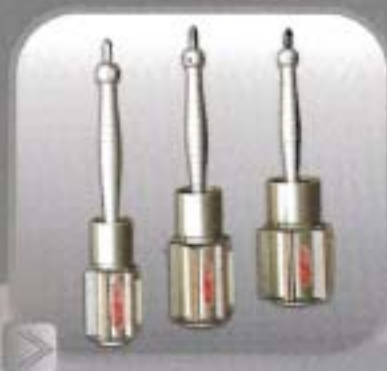
MANDRILES DE CILINDRO Mandriles F.F. línea automotor con avanzador micrométrico universal para cualquier máquina vertical.