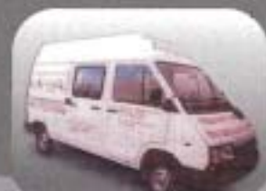
UNIDAD MÓVIL DE DEMOSTRACIONES

FÁBRICA, ADMINISTRACIÓN Y Planta 1: Las Flores 571 - Vill. Planta 2: Zeballos 4048 - Vill. Tel: 4207-9185/4725 Fax: 4207-9185 Mail: correo@famabrunidoras.com.uy ventas@famabrunidoras.com.uy