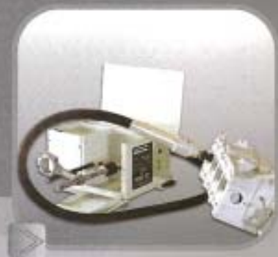
RUGO 100 BRUÑIDORA RUGO 100 Para interior de guías de válvulas.